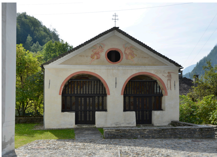
Das Beinhaus in Cauco

Das Archiv erhält immer wieder neue Schenkungen von Dokumenten. Zwei davon gingen im Jahr 2023 ein und werden derzeit katalogisiert und transkribiert. Eine dritte Schenkung aus dem Jahr 2022 enthält Dokumentationsmaterial über die Restaurierungsarbeiten an mehreren Kapellen im Calanca-Tal, die zwischen 1990 und 2010 durchgeführt wurden. Für diese Schenkung erstellten wir ein Digitalisierungsprojekt und suchten separate finanzielle Unterstützung. Wir können nach den Sommerferien mit der Digitalisierung beginnen.